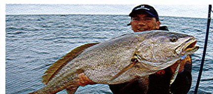
PECHE A BORD Le maigre à La Rochelle

DOM 7,90 € • BEL 7,50 € • CAN 14,25 $ CAN MAR : 85 MAD - PORT.CONT : 8,80 € TOM.S : 1200 x PF