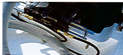
TECHNIQUE La barre hydraulique