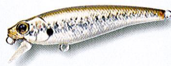
Rip'n Minnow - Cultiva distribué par Pafex