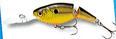
Shad Rap articulé - Rapala

pointes rocheuses successives, en s'opposant aux courants de marée, crée de nombreuses accélérations et venturi qui seront mises à profit par les poissons pour se mettre à l'affût. Toutes ces pointes devront être explorées en priorité et méthodiquement. On y trouve quelques beaux spécimens à poste, mais la plupart du temps ce seront des poissons de passage. Il faut donc trouver ces marques et, surtout, les bonnes heures de passages.