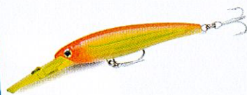
X Rap Magnum 20 - Rapala