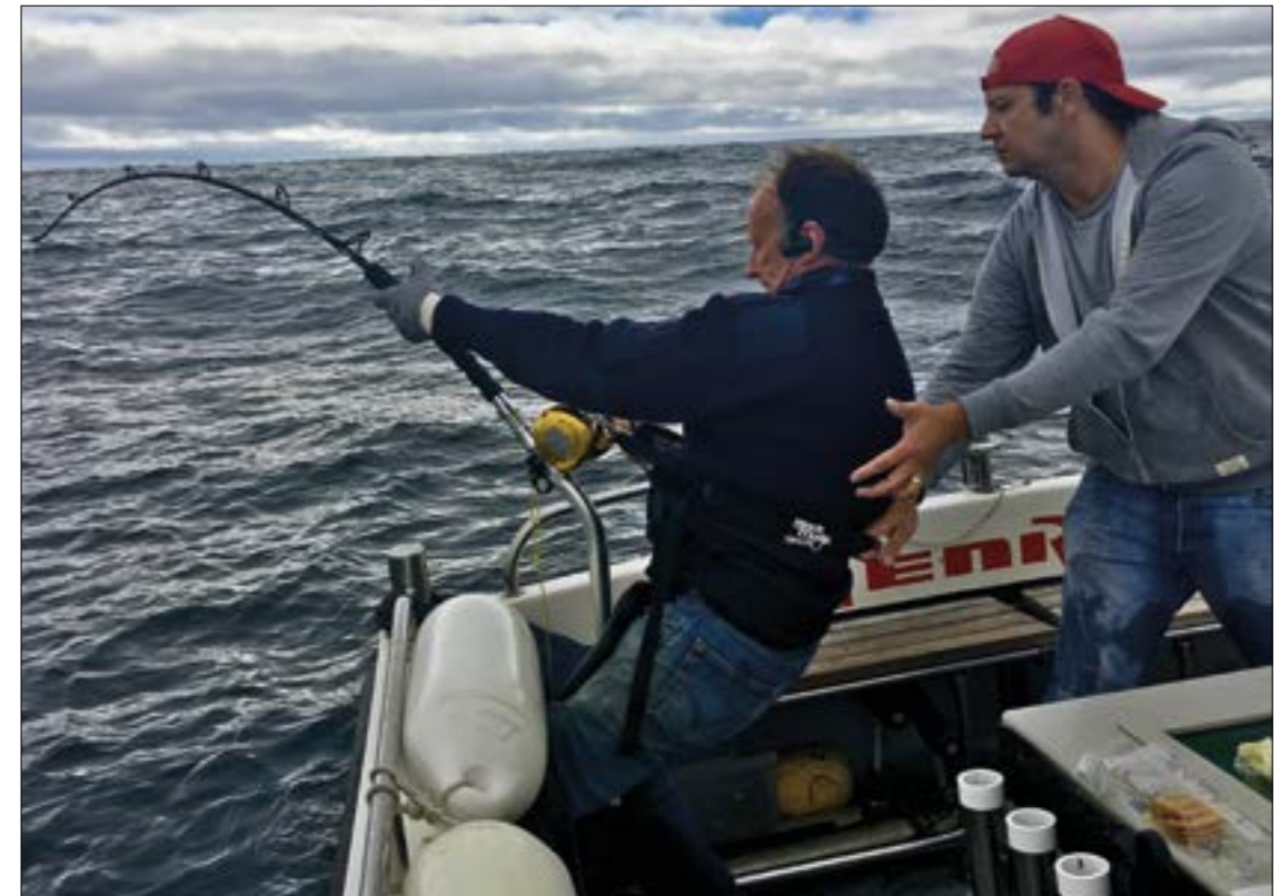
Le combat contre un thon de plus de 300 livres peut durer des heures.

Il me raconte l'épopée d'un thon capturé en octobre au nord de l'Irlande et équipé d'une balise qui y est revenu une année plus tard après être passé en janvier au large du Canada, en mars au milieu de l'Atlantique, en mai par le détroit de Gibraltar, qui a frayé en juin au sud-est des Baléares, puis a retraversé Gibraltar début août, avant de longer les côtes portugaises, puis de tirer droit vers le milieu de l'Atlantique, avant de se faire reprendre en octobre à 50 km à peine du lieu de sa première rencontre avec l'Homme.