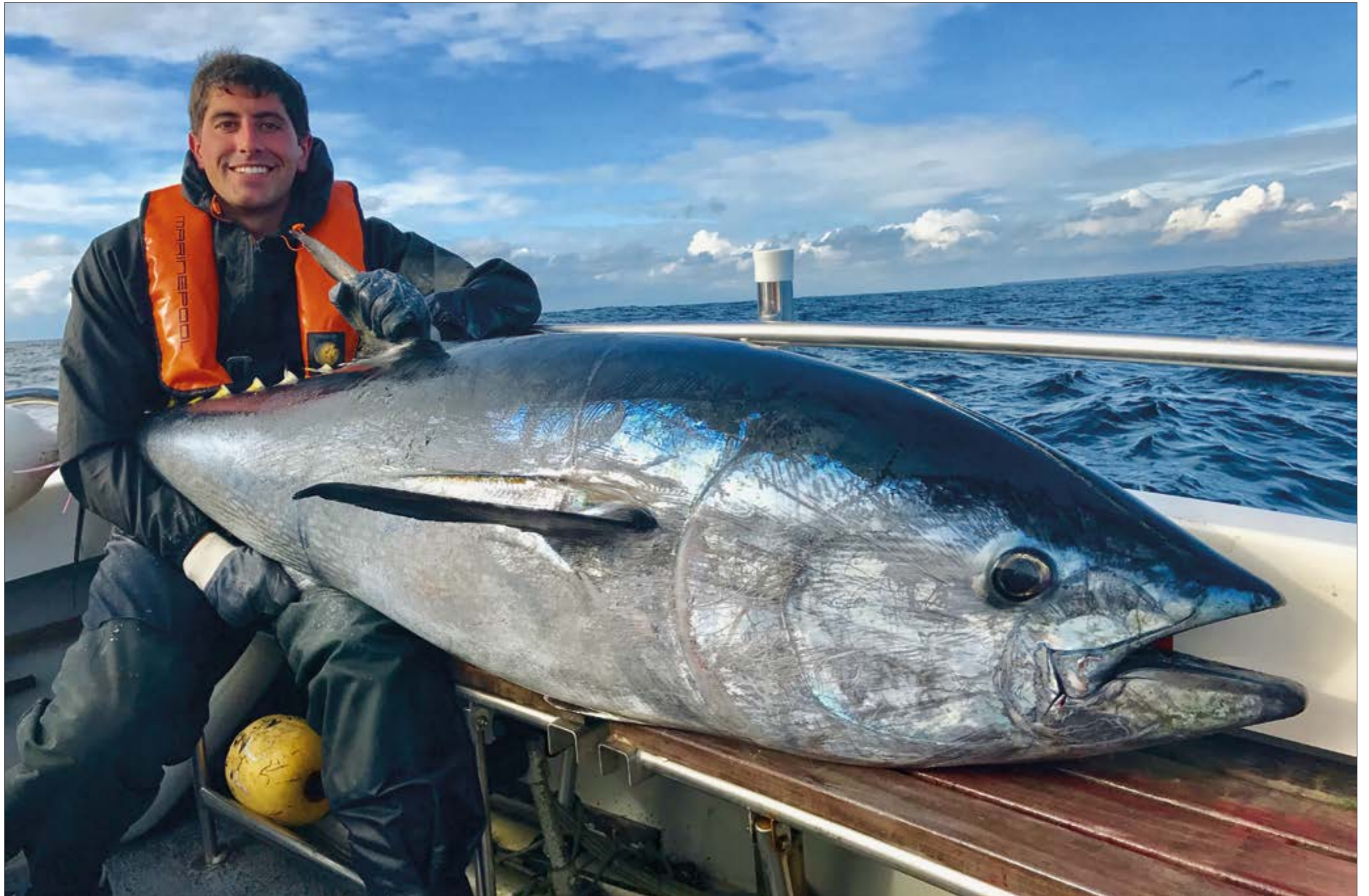
Le grand thon, véritable coureur des océans, est la capture d'une vie.