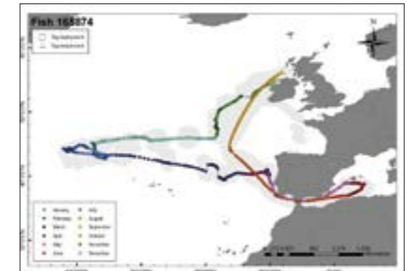
En un an, ce thon a parcouru plus de 10 000 km.

Et puis il restera toujours possible – tant qu'il y aura des thons – de les pêcher au cerf-volant. Cette tech-